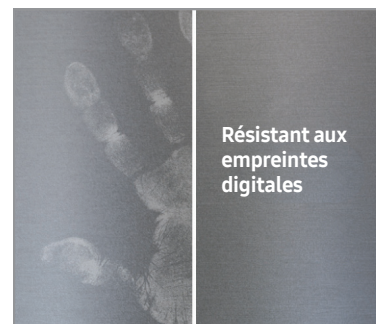
Fini résistant aux empreintes digitales