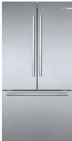
B36CT80SNS Acier inoxydable