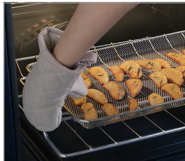
Fonction de friteuse à air chaud Air Fry

Acier inoxydable résistant aux empreintes digitales